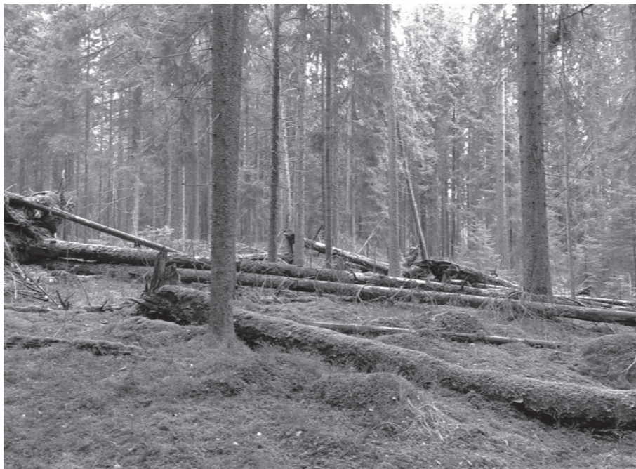
Kuva 1. Kuva Rörstrandin tutkimusalalta.

Kasvualustaluokat olivat inventoinnissamme 1) sammal, 2) karike, 3) kivennäismaa, 4) karikkeinen sammal ja 5) lahopuu. Aineistoa analysoitaessa nämä pelkistettiin luokiksi a) sammal, b) karike/karikkeinen sammal/muu (myöhemmin lyhesti vain ”karike”) ja c) lahopuu. Kivennäismaalla kasvavia taimia oli aineistossa vain muutamia yksittäisiä. Sammalluokkaan laskimme kuuluvaksi vain puhtaan karikkeettoman sammalkerroksen. Karikkeen osittain tai kokonaan peittämä sammal luokiteltiin samaan luokkaan kuin karike. Karike muodostuu kuolleista vähän hajonneista kasvinosista ja se on rakenteeltaan ja ominaisuuksiltaan erilainen kasvualusta kuin pelkkä elävä sammalkerros. Kasvualusta määritettiin silmämääräisesti.