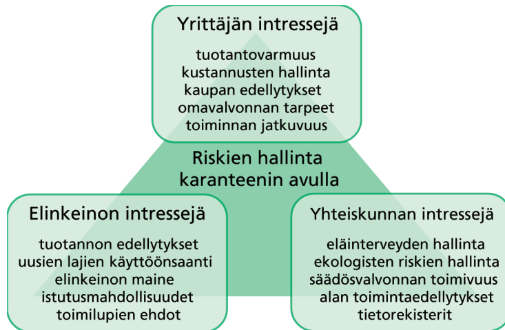
Kuva 1. Eri sidostahojen intressejä karanteenin käyttöön riskinhallinnassa.