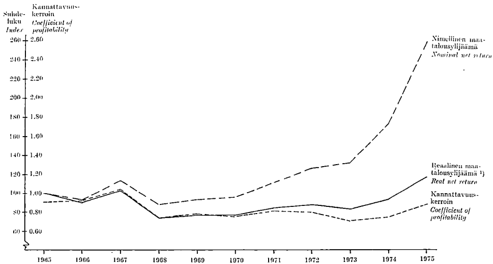
Kuvio 1. Maatalousylijäämän (mk/ha) ja kannattavuuskertoimen kehitys suhdelukuina.

Figure 1. Development of net return to total capital plus imputed wage of operator and family (mk/ha) and coefficient of profitability shown as index numbers.